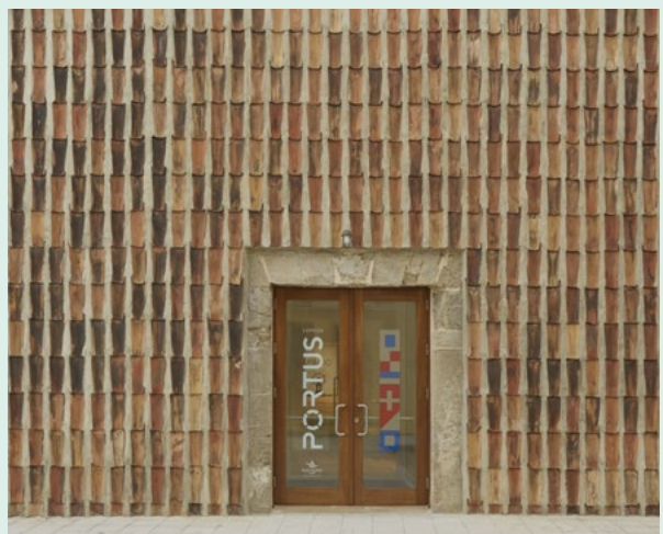
Espacio Portus (Avilés). Arq. Rogelio Ruiz y Macario G. Astorga Arquitectos.

Las tejas cerámicas e incluso los ladrillos cara vista y adoquines cerámicos son productos muy solicitados después de la demolición del edificio para su colocación, tanto en obra nueva como en rehabilitación. La reutilización de ladrillos y tejas ha aumentado en los últimos años, ya que hay una corriente entre proyectistas y constructores que consiste en construir edificios modernos con apariencia tradicional.